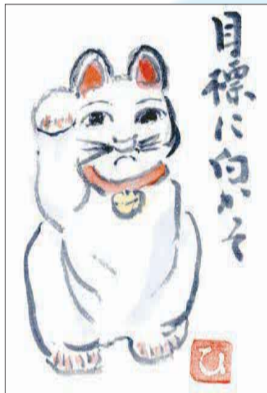
▲ 目標をもって 目標をもって努力してねという気持ち ● 斉藤秀子 (上安松)