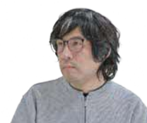
誰かの役に立ちたいという思いです