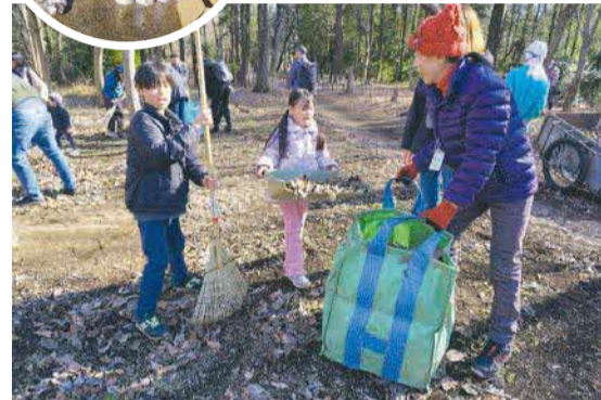
◀1月13日(祝)、所沢カルチャーパークで武蔵野の里山ぐるぐるフェスタが開催されました。子どもと大人が協力して落ち葉を掃き、集めた落ち葉はバイオネストと呼ばれる鳥の巣のような見た目をした堆肥場になりました。