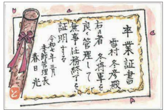
▲ 卒業証書 来年の冬は雪の管理をお願いします ● 仲敏夫 (山口)