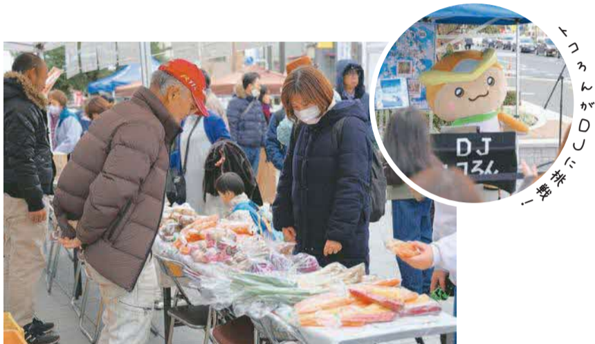
▲1月25日(土)、シティタワー所沢クラッシィ広場で行われたとことこオーガニックマルシェ。新鮮な農産物の販売だけでなく、実際に学校で提供された給食の試食ブースや、まちなかコンサートも同時開催され、会場はたくさんの人でにぎわっていました。