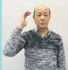
指文字「コ」の形で頭のこめかみのところに持っていく