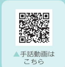
手話動画はこちら