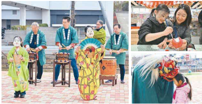
▲新春よっとこ！日本伝統文化祭が1月12日(日)、観光情報・物産館YOT-TOKOで開催。重松流祭りばやしの披露や、だるまの絵付け体験など、来場者は伝統文化を体感しました。