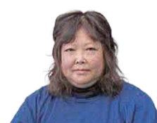
仲間がいれば、頑張れます