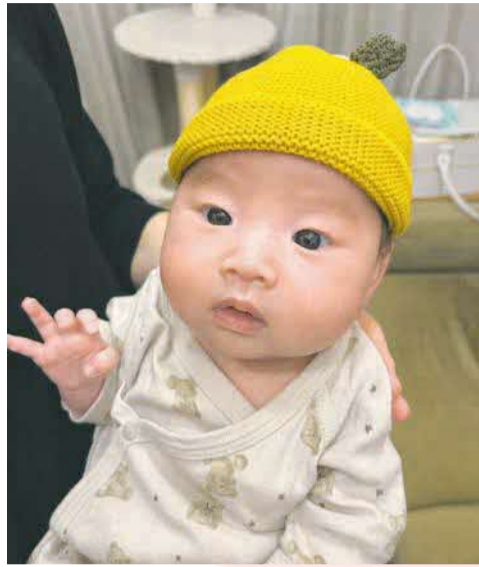
▲ 新しい帽子 みかんの帽子、ぴったりフィット！ ● さびねこ (東所沢和田)