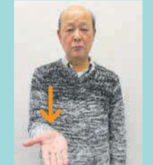
相手に向けて右手を広げる(質問するという意味)