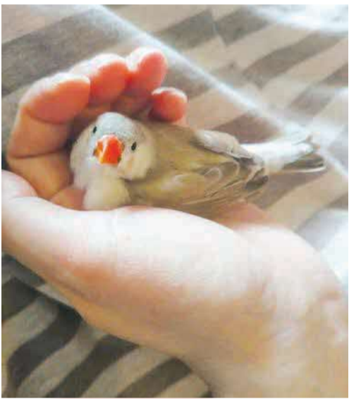
▲ 手のひらの鳥まんじゅう 安心してまったりするとたいらになります ● りり太郎 (北秋津)