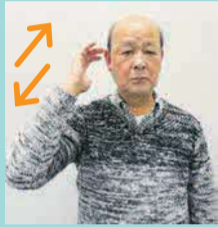
2回ほど少し前後に動かします。