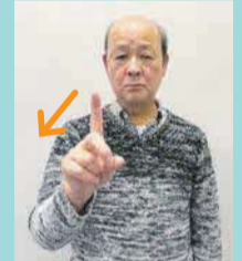
人差し指を立てて、2回ほど左右に動かす