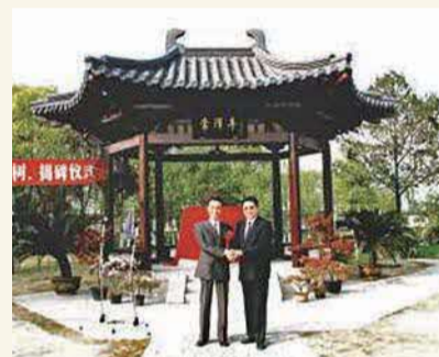
▲姉妹都市締結の記念碑「常澤亭」