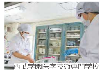
西武学園医学技術専門学校