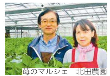
苺のマルシェ 北田農園