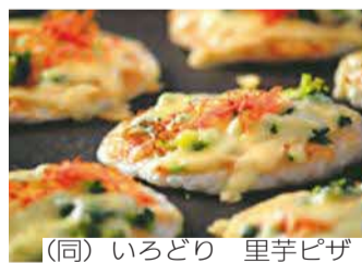
(同) いろどり 里芋ピザ