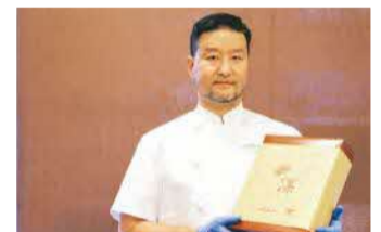
パティスリーモアオシィ