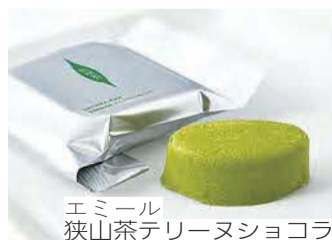
エミール 狭山茶テリヌショコラ