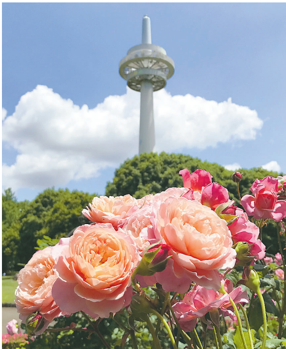
▲航空記念公園のバラ バラ園開放日だったので、間近で綺麗なバラが見られました。花の世話をされている方々に感謝！ ●カーカ（西所沢）