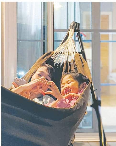
▲仲よし いつまでも一緒にね。二人でつくる仲よしハート ●きせきまま（花園）