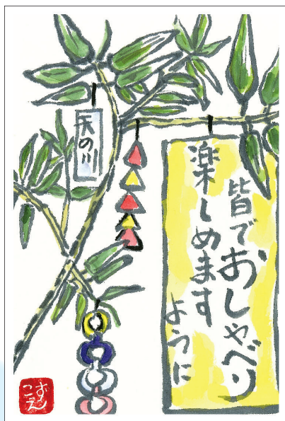
▲七夕 コロナで3年も会っていない友達に今年は会いたいなあ。織姫と彦星も会えるといいね ●山納こずえ（東所沢）