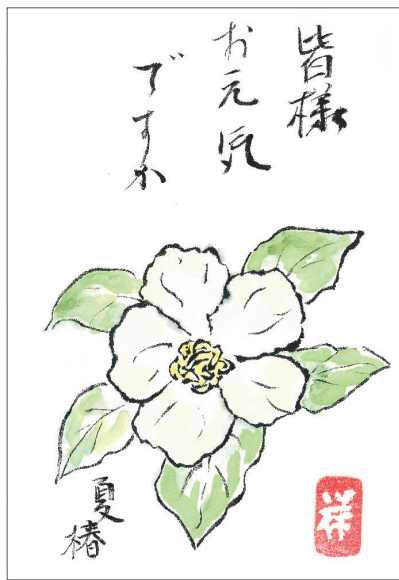
▲もう少しで皆に会えるね 今年こそ夏休みには、家族や友人に会えますように ●らぶりん（荒幡）