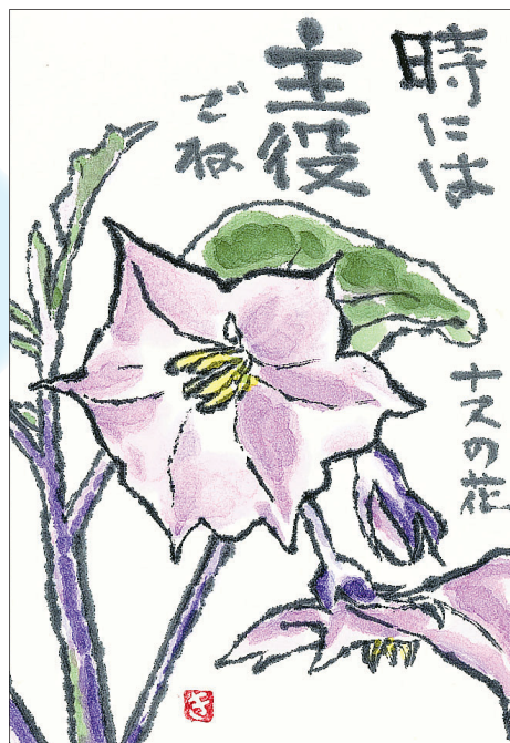
▲野菜の花ってきれいだね 野菜をたくさん食べて暑さに勝とう ●キョウチャン（北中）