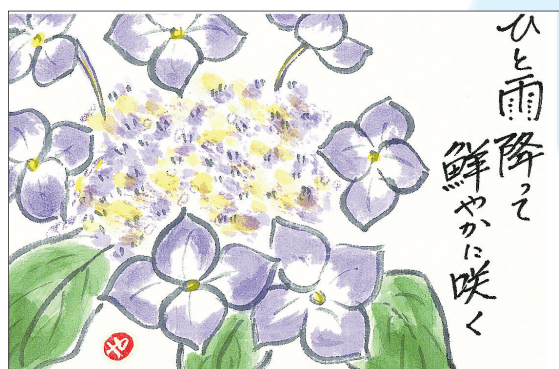
▲幼い思い出あじさいの花 梅雨空によく似合う大輪 ●山下祥子（中新井）