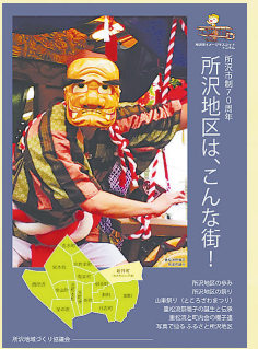
▲PR冊子の表紙「重松流祭囃子 外道の踊り」

所沢地区をもっと知ってもらえるよう、所沢地域づくり協議会では、PR冊子『所沢地区は、こんな街!』を発行。重松流祭囃子保存会、野老澤町造商店のメンバーも加わって、地区の自慢の一つ「ところざわまつり(山車祭り)」に欠かせない重松流祭囃子の歴史や、各町内会(町会)の囃子連、山車などを紹介。さらに地域の伝統と文化継承への想いを込め、地区全体の歩みや歴史ある祭りを紹介し、後世まで末永く楽しめる作品となりました。