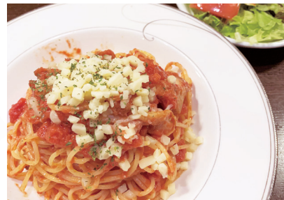
レシピ監修: イタリアンレストラン「パスタ・デルフィーノ」