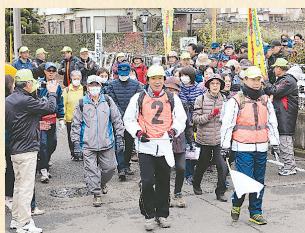
▲実際に歩いてみて、富岡地区の良さを感じよう!

コースは11kmの健脚コース、7kmのファミリーコースの2種類。初春の澄み切った空気を味わいながら、自然豊かなコースを散策するのは格別!富岡地区の方なら誰でも参加できますので、健康づくりのためチャレンジしてみませんか?