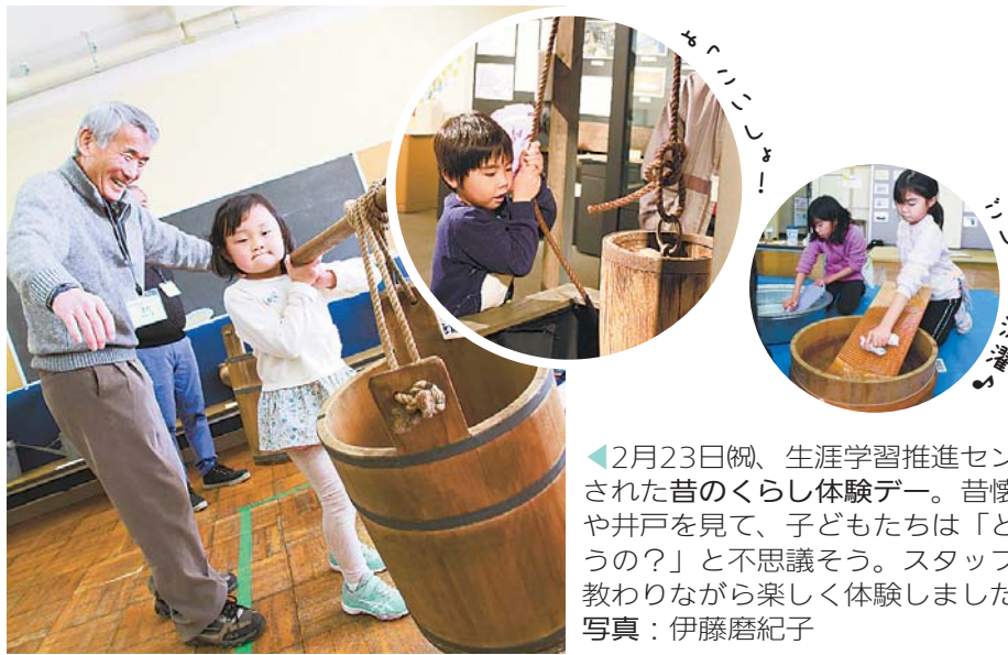
◀2月23日(祝)、生涯学習推進センターで開催された昔のくらし体験デー。昔懐かしい天秤や井戸を見て、子どもたちは「どうやって使うの?」と不思議そう。スタッフに使い方を教わりながら楽しく体験しました。