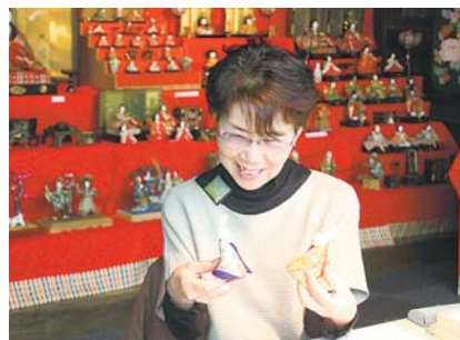
◀2月8日(土)～3月8日(日)まで中心市街地で行われた野老澤雛物語。2月25日(火)には、野老澤町造商店で手のひらサイズのうさぎのおひな様を作る講座が開催。色鮮やかな着物に身を包んだかわいらしいおひな様が完成しました。