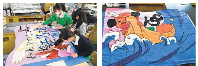
▲2011年から続く、所沢西高校の東日本大震災の被災地支援ボランティア活動。2月14日(金)、美術部を中心とした有志メンバー約20人が、いわきサンシャインマラソンを応援する大漁旗を製作し、遠い地から思いを寄せました。

⚠️ 新型コロナウイルスの感染が疑われる場合や同ウイルスに関する情報は、本号4面をご覧ください。