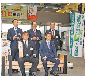
▲5市の市長が共同で宣言

昨年11月、2050年までに市内の二酸化炭素排出量実質ゼロを目指す「ゼロカーボンシティ」を表明した所沢市。この取り組みをさらに連携して進めようと、ダイアプランを構成する近隣5市（所沢・飯能・狭山・入間・日高）が、2月15日に共同で宣言を行いました。今後、5市が協力して再生エネルギーの利用促進や森林の活用などを一層進めます。