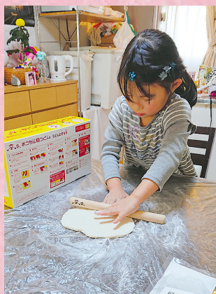
▲おうち山田うどん おうち時間に初めての手打ちうどん。真剣に打ったうどんはおいしい♪ ●やまだキッズ(並木)