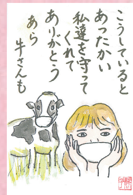
▲みんなの必需品感謝を込めました ●堀口の静御前(上山口)