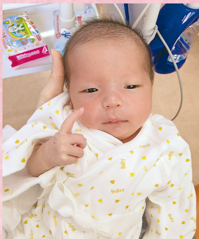
▲あれ?トUSS!? 産まれて7日。所沢ゆかりのお笑い芸人・オードリーの春日さんの「トUSS!」をピースの前に覚えてしまった娘でした ●タカタカ(荒幡)