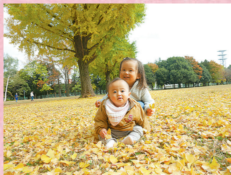
▲航空公園で秋探し 「お姉ちゃん、黄色くておいしそうなのがいっぱいあるね」「食べちゃダメー!」 ●たまねぎマン(久米)