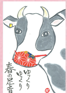
▲大事なマスク牛歩で力強くコロナを退治! ●前向き(中新井)