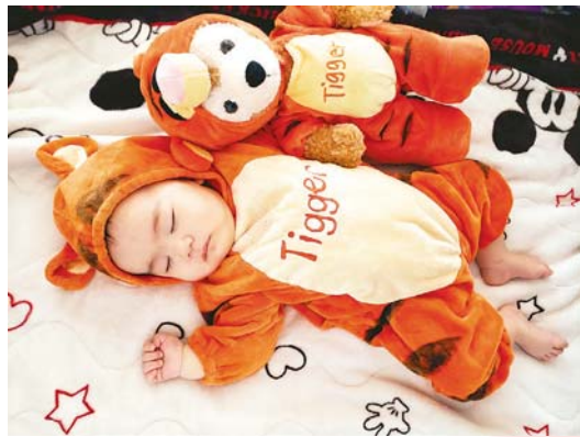
▲トラさんたちのお昼寝 おそろいの着ぐるみで 仲良くスヤスヤ ●るーたん（下富）