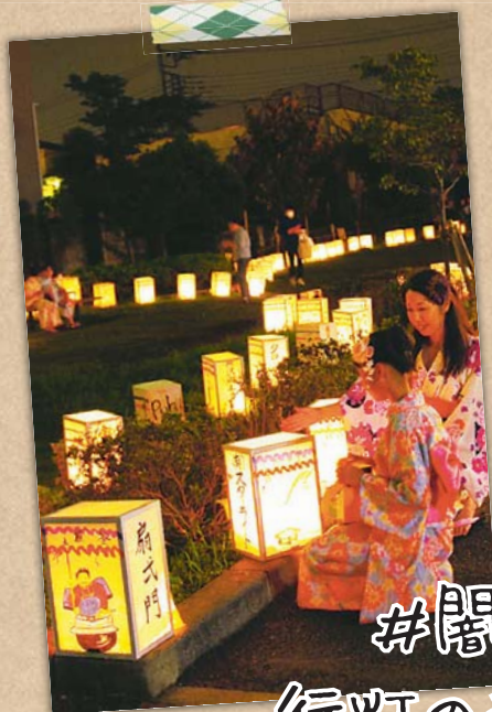
⑦野老澤行灯廊火 所沢伝統の地口行灯が夏の夜を彩ります。暗闇では、明るいところにピントを合わせると、灯りが際立ち、幻想的な写真に。 ☎遠井洋子 場所澤神明社ほか