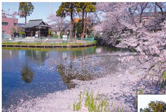
④岩崎弁財天の桜 満開の桜は、散った後もシャッターチャンス。花びらの色が変わる前が狙い目です。 ☎佐藤清一郎 場山口 710-1