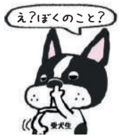
▲職員採用キャラクター 受犬生くん

問職員課 ☎2998-9048 FAX 2998-9042 ✉a9048@city.tokorozawa.lg.jp