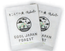
▲来場者に COOL JAPAN FOREST 構想ロゴ入り狭山茶をプレゼント!