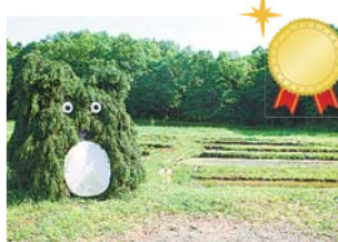
▲前回投票で景観賞になった 穂谷八幡湿地保全活動