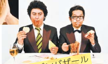
バンバンバザール