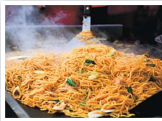
とろざわ 醤油焼きそば 食べてみて！