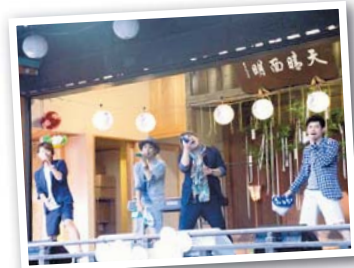
▲所沢市観光大使JAY'S GARDENのライブも開催（七夕祭り）