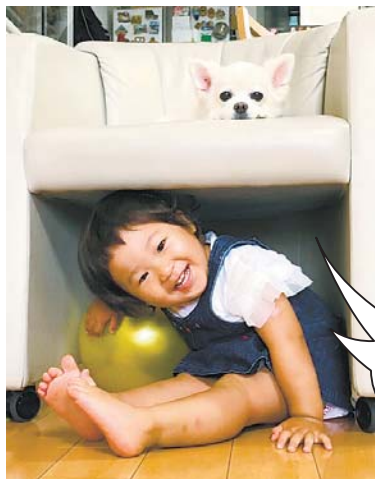
◀我が家のちっちゃいものクラブ！ いつも仲良しで、一緒に遊んで一緒にお昼寝をしています。 ●ゆづきママ(星の宮)