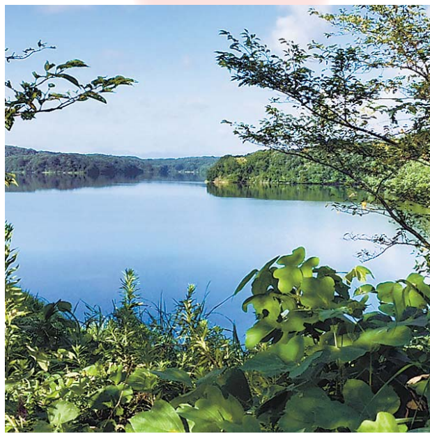
▲狭山湖の朝 お天気や季節による百面相のような景色を、定点カメラのごとく楽しんでます。 ●六本木 満美子