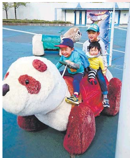
▲初めての西武園うえんち 三男が産まれてから初めて、家族そろって行きました。楽しかったね! ●まるは(林)

▼一人じゃまだ無理だよ?一緒に滑ってる時は楽しそうだったのに、一人にしたらこの表情!