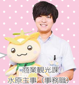
商業観光課 水原主事(事務職)

人数が少なく、若手が1人で担当するキツイ仕事もあります。でも、観光は頑張った分だけ結果が出る仕事なので、 成功したときの達成感は大きいですね!