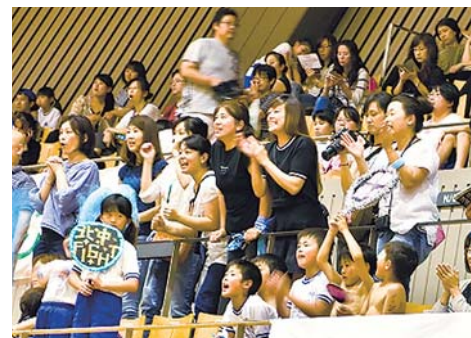
/ がんばれ〜! \