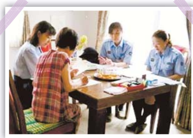
▲防火チェック、結果は良好!

講 消防職員と女性消防団員による防火に関するチェック 問 所沢中央消防署予防指導課 ☎ 2929・9133