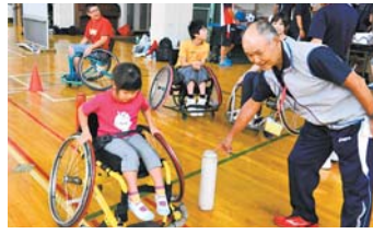
▲コツをつかめば、楽しいね♪

7 月 31 日(日) 午後 1 時～ 場 市民体育館 対 誰でも参加可能 費 1,000 円 (保険代含む) 持 上履き (土足不可) ◎ 会場へ直接お越しください。 ☎ 埼玉県障がい者スポーツ指導者協議会 西南部地域支援連絡会 ☎ 090・6760・32003