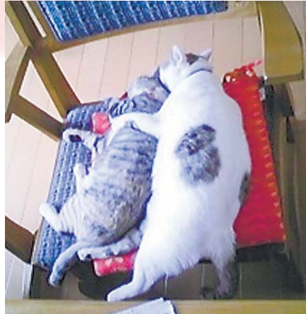
▶我が家のニャンコたち ニャン吉（右）が後から来たミミを本当の父親のようにかわいがっていますが、最近はずつこすぎてミミが逃げていますf^_^;) ●じゅん吉