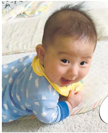
◀初めての寝返り 4カ月になる息子が初めて寝返りをした後、このドヤ顔。 ●ともくんママ（緑町）