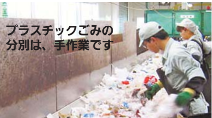
プラスチックごみの分別は、手作業です

プラスチックの中に異物やペットボトルが混ざり、リサイクルできない事態が発生しています。適切にごみ分別で資源化にご協力ください。