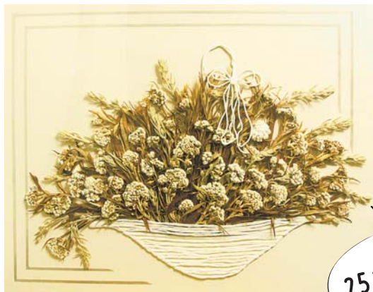
▶思い出のブーケ 25年前に作った押し花のブーケ。今も額の中できれいに咲き続けています。 ●鈴（中富南）