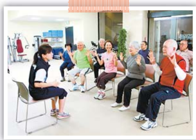
▲楽しく健康づくり!

申 7月8日(金)までの月・金曜日午前10時〜午後5時に希望施設に電話 問 高齢者支援課 ☎ 2998・9120