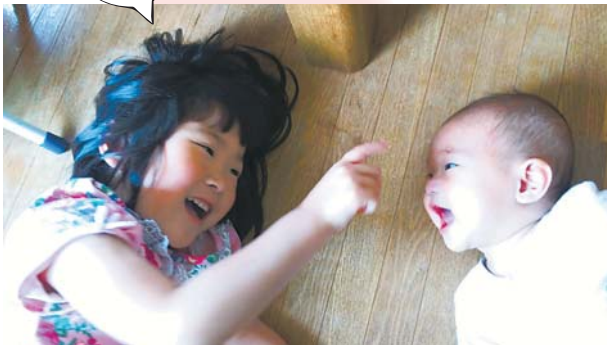
▶大好きな弟♪ お姉ちゃん（5歳）は弟（5カ月）が大好き♡ ●まさこう（元町）