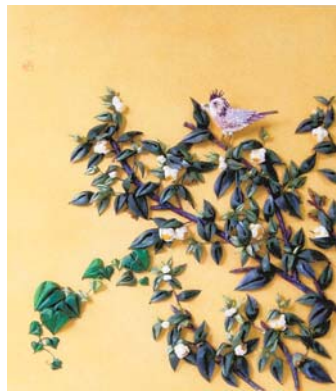
◀静寂 お茶畑にひばり。ある日出会った所沢のシンボルをつまみ画※で創作しました。 ●山田弘代 (小手指南) ※布をつまんで作る手芸作品