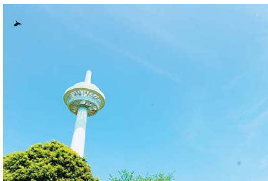
▲見上げたくなる空 散歩中に空を見ると、とてもきれいな青空が広がっていてなんだかハッピーな気分でした(^-^) ●Panda (久米)