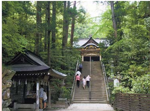
▶新緑の宝登山神社 寺社を撮るのが好きです。今年は秩父三社巡り制覇します！ ●Rena (東町)