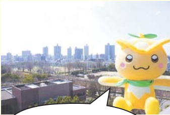
畑や森、都会的な街並みなど、ロケ地にふさわしい場所が多いね

5〜7月はカラスが卵やヒナを守るように、巣の近くを通る人に向かって、大声で鳴いたり、頭上に飛来して足で蹴ったりついたりするなどの攻撃をすることがあります。ご注意ください。