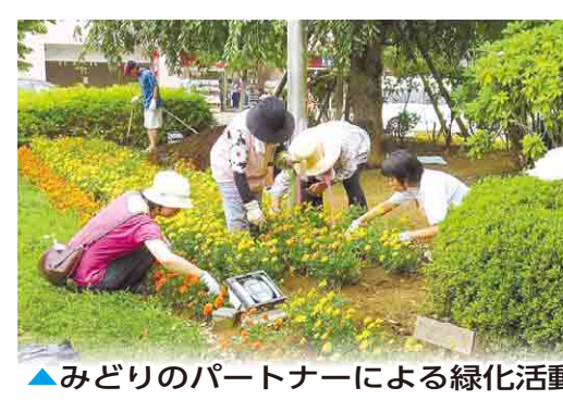
▲みどりのパートナーによる緑化活動…緑の保全活動は国土交通大臣賞を受賞。