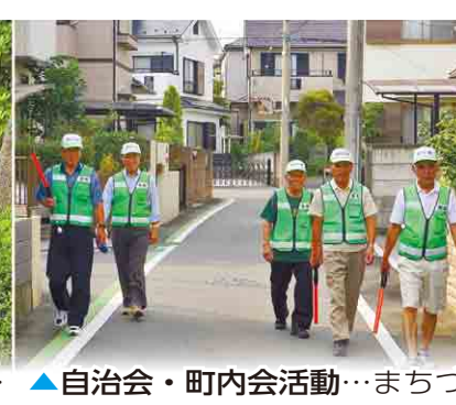
▲自治会・町内会活動…まちづくりは一人一人の参加から。