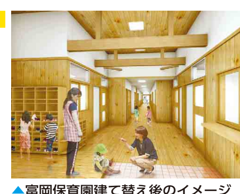
▲富岡保育園建て替え後のイメージ