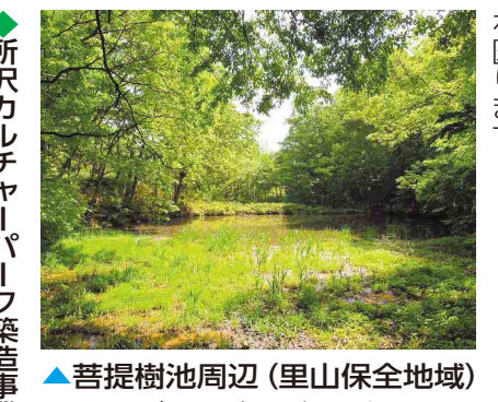
▲菩提樹池周辺(里山保全地域) …みどりも市の宝です。