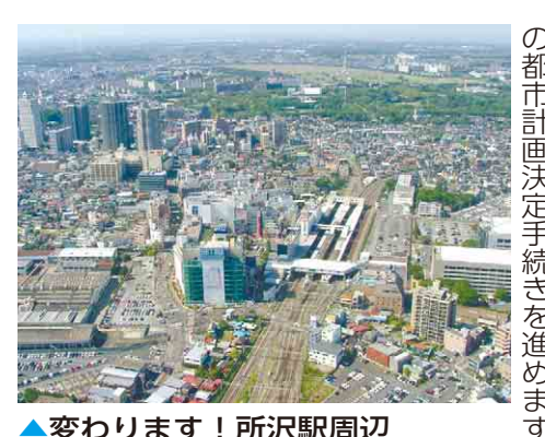
▲変わります！所沢駅周辺

私の市政運営の原点、それは東日本大震災の記憶です。大震災と原発事故を経験した私たちの大人たちには、託された使命があるのです。それは、未来の子どもたちにとってどんな社会を伝え残していくか、しっかりと見定め、今動け、ということです。子どもたちに残していくべきは、「人と人との絆・支えあう力を強め、一人一人が人間力を発揮する社会」であり、「人と自然との共生が図られた社会」であると考えます。市行政も、経済活動も、自治会活動も、みんなが楽しむ各種スポーツや文化活動も、実は「あなたと私が幸せになる」ためにあるのではありませんか。だから、みんなで参加して、みんなで考えて、ともに汗を流していきましょう！私は、これまで「動け！所沢 紡ごう！絆」のフレーズで思いを