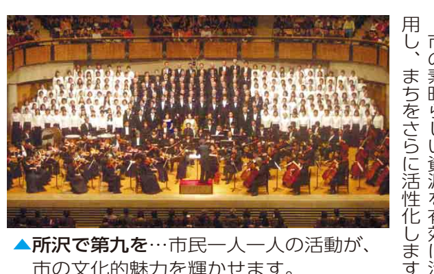
▲所沢で第九を…市民一人一人の活動が、市の文化的魅力を輝かせます。