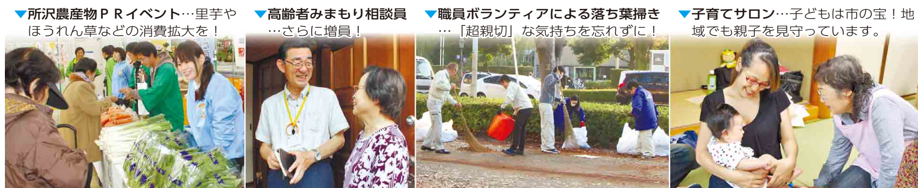
▼所沢農産物PRイベント…里芋やほうれん草などの消費拡大を！ ▼高齢者みまもり相談員…さらに増員！ ▼職員ボランティアによる落ち葉掃き…「超親切」な気持ちを忘れずに！ ▼子育てサロン…子どもは市の宝！地域でも親子を見守っています。