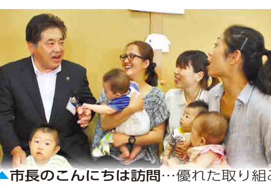
▲市長のこんには訪問…優れた取り組みを広めています。