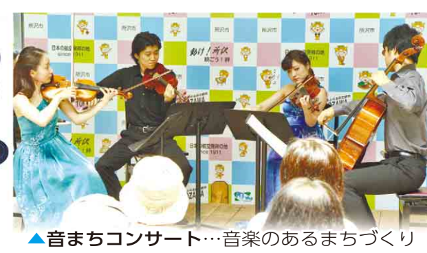
▲音まちコンサート…音楽のあるまちづくりを推進中！