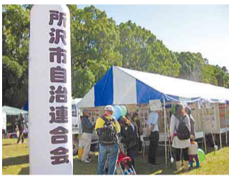
▲所沢市民フェスティバルでの活動PR

所自連では、所沢市民フェスティバルで自治会・町内会活動のPRや、転入者に、加入促進のパンフレットを配布して加入を呼び掛けています。他にも、市への要望や市議会との意見交換、環境美化、防犯・防災活動や地区の視察研修などへの補助など、活動は多岐にわたります。