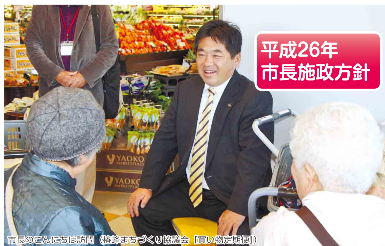
平成26年市長施政方針