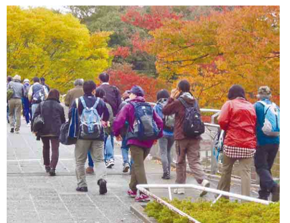
▲前回のイベントの様子

みどりのふれあいウォーク 日 5月6日(木) (雨天決行・荒天中止) 受付 午前9時～10時30分 集合場所 小手指駅北口 コース 約11km (所要時間約3時間) / 左図参照 【留意事項】 ▼ 歩きやすい服装、トレッキングシューズなどでご参加ください。 ▼ 昼食や十分な飲み物、雨具など季節に合った装備を持ってご参加ください。 問 詳細は 市HP をご覧ください。 みどり自然課 ☎ 2998-9373 ▼ 交通ルール・マナーを守り、車に注意して歩きましょう。 ▼ ごみは必ずお持ち帰りください。 ▼ けが、事故などの責任は負いかねますのでご了承ください。