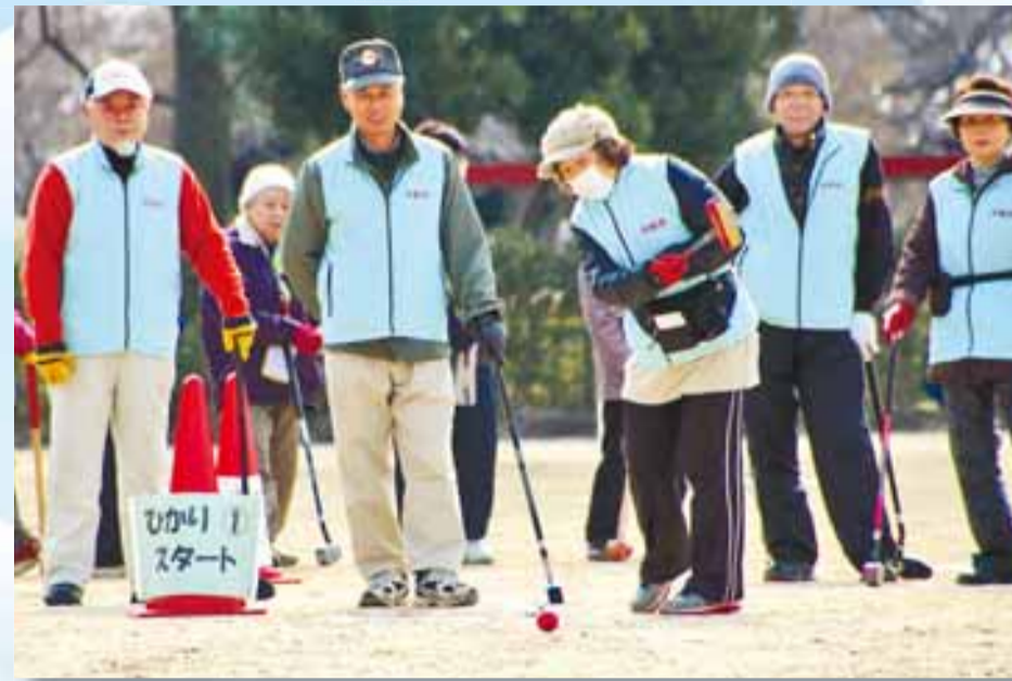
▲市内6会場でグランドゴルフとベタソクの試合が行われた「第12回市民体力づくり大会」。この日は約600人の参加者が各会場に分かれ、寒さにも負けずそれぞれの競技を楽しみました。 3月9日(日)／所沢航空記念公園