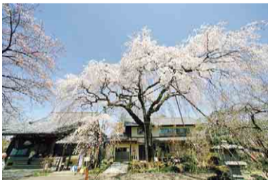
▲金仙寺のしだれ桜

三ヶ島地区にある金仙寺は、平安時代に創建された歴史あるお寺です。境内には、樹齢約150年といわれる有名なしだれ桜があり、満開期には多くの方が訪れます。