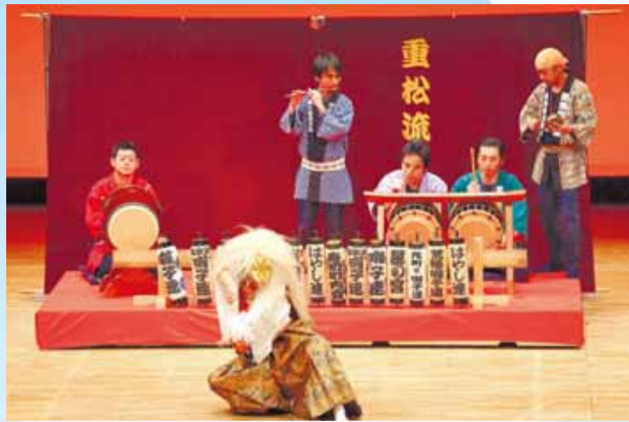
▲市内に受け継がれる民俗芸能への理解を深め、後継者育成を図ることを目的に開催された「第11回所沢市伝統芸能発表会」。所沢市無形民俗文化財の重松流祭ばやしと岩崎獅子舞を継承している7団体が、日ごろの練習の成果を披露しました。 2月23日(日)／市民文化センターミュージアム中ホール