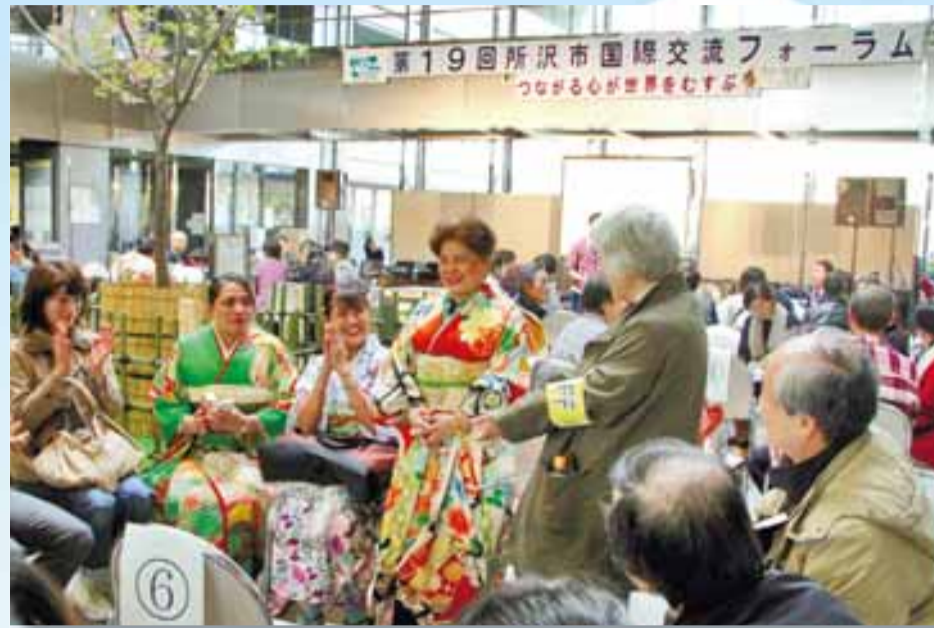
▲「つながる心が世界をむすぶ」をテーマに今年も開催された「第19回所沢市国際交流フォーラム」。市内在住の外国人とのディスカッションや着物着付け体験、世界と日本のお茶の試飲など、参加者は異文化交流を楽しみました。 3月16日(日)／市役所1階市民ホール