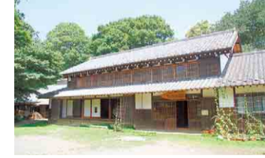
▲旧和田家住宅（クロスケの家）主屋