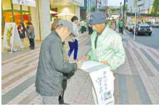
▲所沢駅前での署名活動

平成25年5月の「西武鉄道(株)の鉄道路線の維持及び埼玉西武ライオンズの存続を求める署名活動」では、所自連が中心となり所沢駅前で行った署名活動や、自治会・町内会長の声掛けによる署名活動によって、一つの強い思いとして16万人を超える方々にご協力をいただきました。これは、日頃からのご近所づきあいが実を結び、自治会・町内会が一つになり大きな力となった出来事でした。