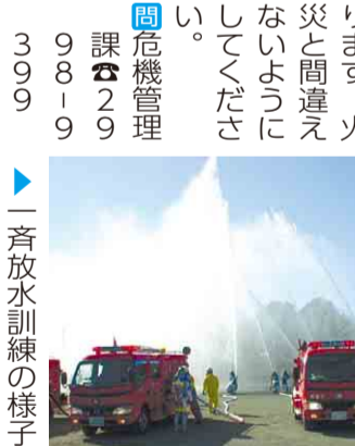
▲一斉放水訓練の様子

消防団の厳正な規律や消防技術を多くの市民の皆さんに披露します。 日 11月17日(日)午前8時30分～11時50分（雨天の場合は、午前10時から体育館で式典のみを実施） 場 上山口中学校（上山口72番地） 交通 小手指駅南口から西武バス「椿峰二ユータウン行き」または航空公園駅東口からところバス「南路線（山口循環コース）」で「椿峰小学校入口」下車徒歩5分 ◎会場には、駐車場はありません。公共交通機関をご利用ください。 ◎市長による消防団員の規律および消防技術の点検、消防車両の行進・展示、放水訓練など ◎午前7時に第7分団詰所（山口）においてサイレンが鳴ります。火災と間違えないようにしてください。 問 危機管理課 ☎ 2998-9079