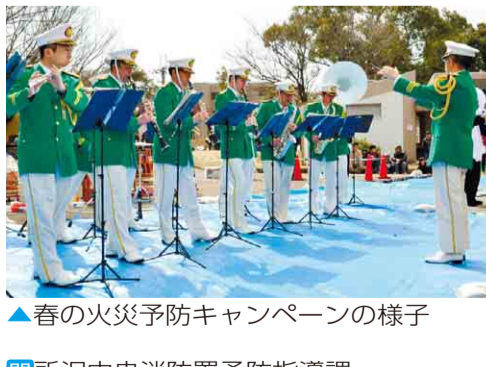
▲春の火災予防キャンペーンの様子

全国統一防火標語 消すまでは 心の警報 ONのまま 期間 11月9日(土)～15日(金) 重点目標 ▶住宅防火対策の推進 ▶放火火災・連続放火火災防止対策の推進 ▶特定防火対象物等における防火安全対策の徹底 ▶製品火災の発生防止に向けた取組の推進 ▶多数の観客等が参加する行事に対する火災予防指導等の徹底 ◆火災予防キャンペーン 日 11月9日(土)午後1時30分～3時 場 パルコ新所沢店中央通路 内 泉町保育園・消防音楽隊による防火演奏、消防車両の展示など 問 所沢中央消防署予防指導課 ☎ 2929-9133