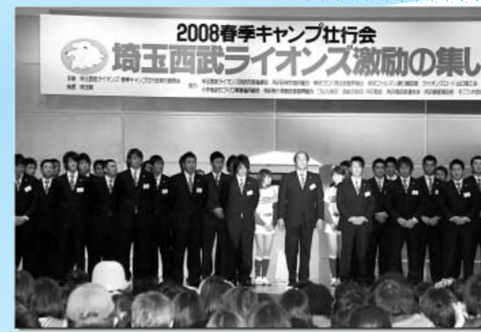
▲春季キャンプ壮行会『埼玉西武ライオンズ激励の集い』に、約4,200人のライオンズファンが選手達を激励するために集まりました。 1月28日(月)「くすのきホール」(くすのき台・西武第二ビル8F)