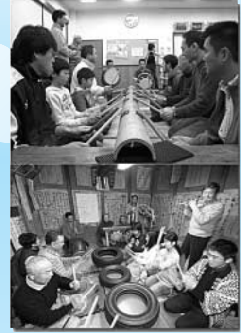
▲3月9日(日)に市民文化センターミュージックで行われる伝統芸能発表会に向けて、練習に余念がない重松流祭囃子保存会星の宮囃子連(写真上/1月19日(土)・星の宮会館)と北野神明囃子連(写真下/1月26日(土)・大籠家稽古場)の皆さん。