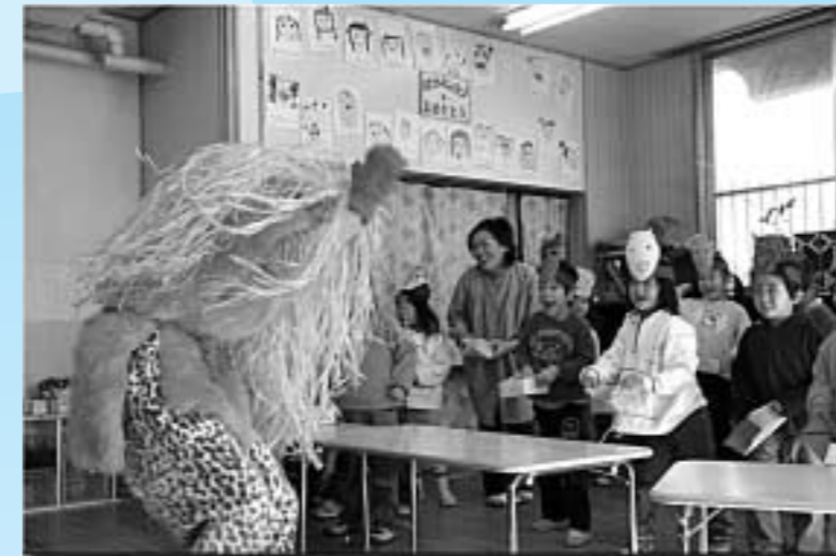
▲「鬼はあ〜、そと！」元気な子どもたちからたくさんのお豆を浴びて、鬼は外に逃げ出しました。 2月1日(金)/並木保育園・豆まき会