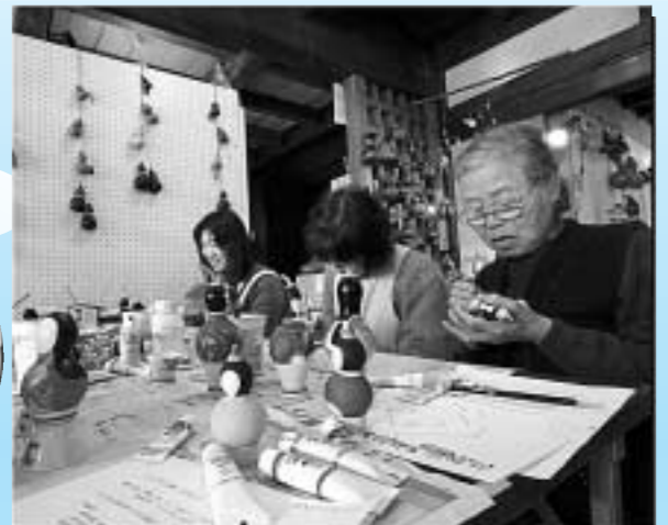
▲体験学習会「ひょうたんで作るお雛様」が開催され、かわいらしいお雛様が並びました。 2月11日(祝)/井筒屋町造商店(寿町) ◎井筒屋町造商店は3月末で閉店します。