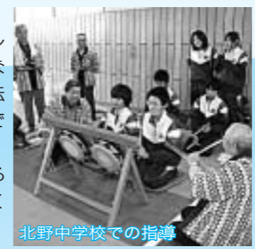
北野中学校での指導