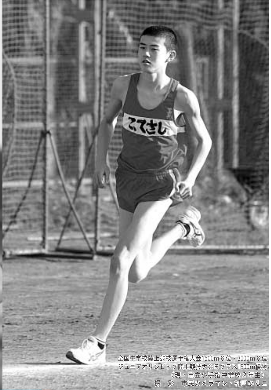
全国中学校陸上競技選手権大会1500m 6位・3000m 6位 ジュニアオリンピック陸上競技大会Bクラス1500m優勝 (現・市立小手指中学校2年生)