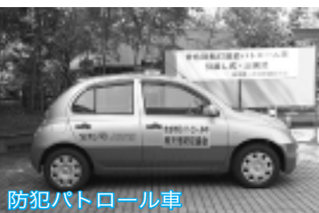
防犯パトロール車

市では、警察や市民・事業者の皆さんとの連携により犯罪の機会を減らし、犯罪を起こさせにくい地域環境づくりを行う「防犯のまちづくり」を推進しています。