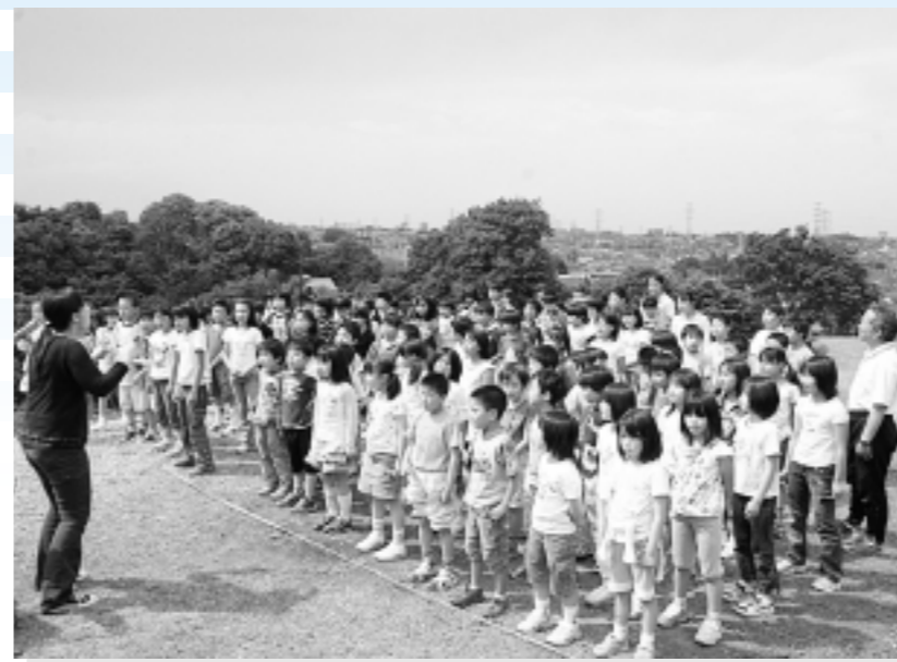
▲「ドレミの丘公園」の開園式が行われ、荒幡小学校の児童の皆さんが、「ドレミの歌」を元気に披露しました。5月24日(水)ドレミの丘公園(荒幡)