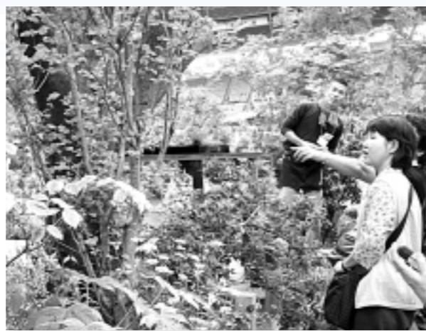
◀美しいバラと庭に多くの人々が魅せられました。「これは何の木ですか」と熱心に尋ねる方も…「国際バラとガーデニングショウ」。5月19日(金)～24日(水)ノインボイス SEIBUドーム