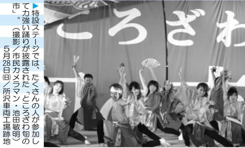
▶特設ステージでは、たくさんの方が参加して力強い踊りが披露された「ところざわ旬の市」。 5月28日(日)所沢車両工場跡地