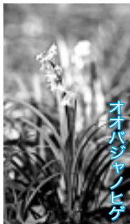
オオバジャノヒゲ

日本にいるのは25種類。狭山丘陵では、アカシジミ、ウラナミアカシジミ、オオミドリシジミ、ミズイロオナガシジミなどが見られます。これらのチョウは夏、秋、冬を卵で過ごし、春になるとふ化した幼虫は、コナラやクヌギの葉を食べ、サナギを経て成虫になります。