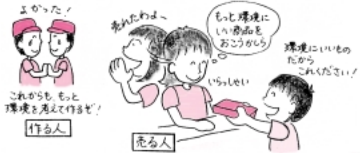
▲イラスト出典：「やってみよう！グリーン購入」より