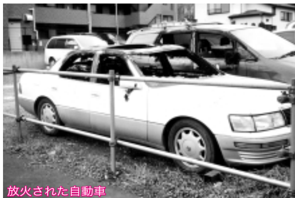
放火された自動車

編集・発行：所沢市役所総合政策部秘書広報課 〒359-8501・埼玉県所沢市並木一丁目1番地の1 ☎04(2998)9024・FAX04(2994)0706 ホームページアドレス http://www.city.tokorozawa.saitama.jp テレホンガイドところざわ ☎0120(432)834