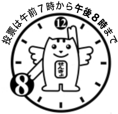
平成15年度 明るい選挙啓発ポスター 埼玉県入賞(入選)作品

編集・発行：所沢市役所総合政策部秘書広報課 〒359-8501・埼玉県所沢市並木一丁目1番地の1 ☎042(998)9024・FAX042(994)0706 ホームページアドレス http://www.city.tokorozawa.saitama.jp テレホンガイドところざわ ☎0120(432)834