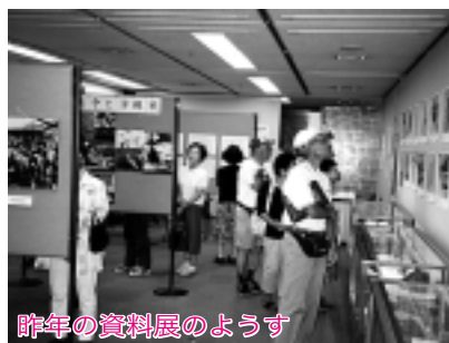
昨年の資料展の様子