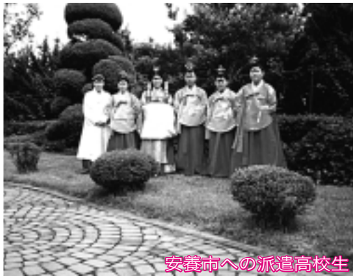
安養市への派遣高校生

受入人員 8人 期間 7月23日(水)～8月5日(火)全 日程14日間/期間を前・後期に分