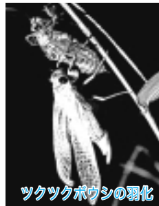
ツクツクボウシの弱体化