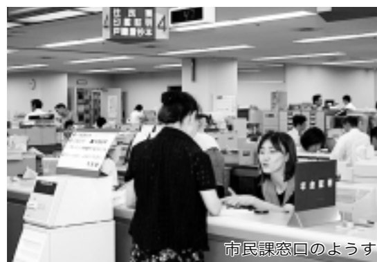
市民課窓口の様子

●個人情報保護についてはどのようにお考えですか。 市長 住基ネットは、全ての市区町村をネットワークで結ぶことになり、個人情報の保護は重要な課題です。このシステムでは、制度面においては、住民基本台帳法が整備されており、技術・運用面においても十分な対策が施されています。しかしながら、より一層の個人情報の保護を図るため、全国市長会においても、セキュリティの確保、制度・運用・技術面等に関する責任体制を明確にするともに、法に定める目的以外に個人情報の利用が行われないようにする等プライバシー保護の措置を講じるべく、関係省庁等の各方面に対して要望をしました。個人情報保護対策を最優先に進め、住基ネットの運用には万全を期してまいりますので、皆様のご理解とご協力をお願いいたします。