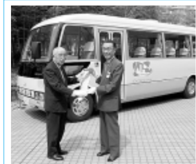
春の交通安全運動 出陣式を行いました

5月18日(金)から改正都市計画図が施行され、市街化調整区域における既存宅地確認制度が廃止されます。これにより、既存宅地確認を受けて建築する予定がある場合は、5月17日(木)までに開発指導課へ申請してください。ただし、非自己用の建築物(分譲住宅や賃貸住宅、貸店舗など)については、5月18日(金)以降、既存宅地確認制度が廃止されることがありません。 また、県ではこれまでの既存宅地確認制度の役割や基準を踏まえ、新たな許可基準を定めました。この基準に適合すれば、5月18日(金)以降でも許可を受けて建築することができます。 なお、この基準では非自己用の建築物も建築可能です。許可基準の主な要件は次のとおりです。 ①集積性の要件：50戸連たんまたは、密度 ②宅地性の要件：市街化調整区域とされた時点の土地登記地目が宅地であること等 【許可基準】 予定建築物 原則として、第二種低層住居専用地域に建築できる建築物で、建ぺい率は60%以下、容積率は200%以下、高さは原則10m以下 用途指定のある地域の場合は指定に従ってください。 敷地の最低面積 原則として150㎡以上 開発指導課 (☎998-9379)