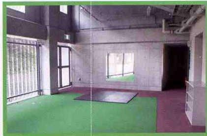
ウォーミングアップコーナー