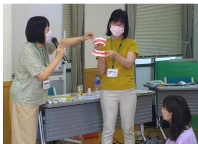
〈0歳からの歯みがきステップ〉

お子さんの誕生を心待ちにするママ同士の交流やスクラップブック作りを行っています。