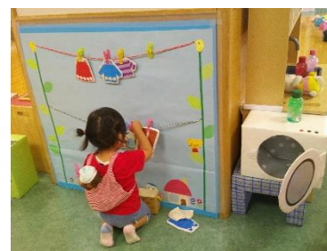
〈手作りおもちゃコーナー〉

歯科衛生士さんから、成長に合わせたお口のケアや仕上げみがきのコツなどを学べる人気の講座です。