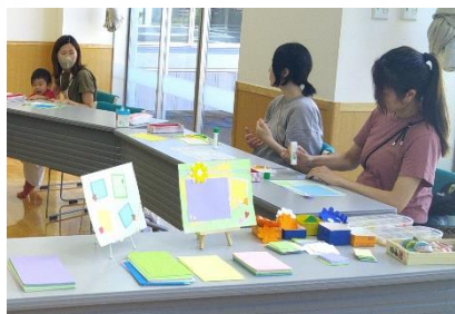
〈マタニティママあつまれ〉

4歳未満の乳幼児の親子が安心してゆったり過ごすことができ、親子同士が気軽に交流できる空間を提供しています。