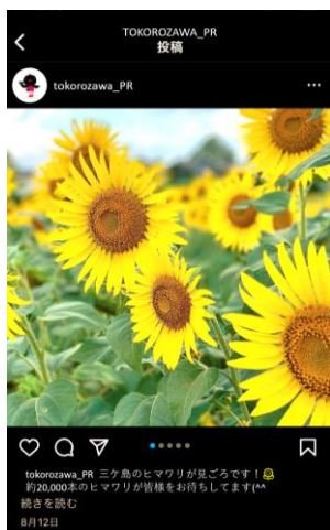
投稿イメージです