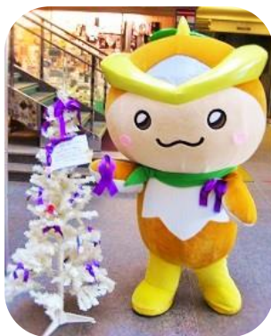
パープルリボンツリーの展示