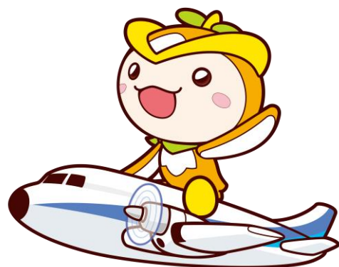
所沢市イメージマスコット