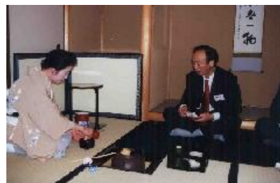
姉妹都市 常州市(中国)訪問団