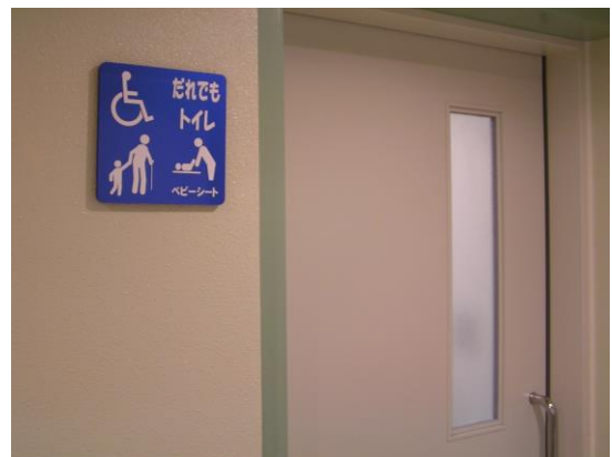
ユニバーサルデザインの例