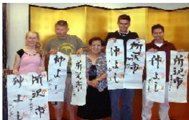
姉妹都市 ディケイター市(アメリカ)の学生

【説明】 外国籍市民との交流実績を示す指標です。 現状値は、平成25年度の国際交流フォーラムのスタッフ等も含めた参加人数です。 目標値は、毎年度10人の増加をめざすものです。