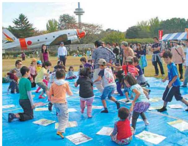
第36回所沢市民フェスティバル