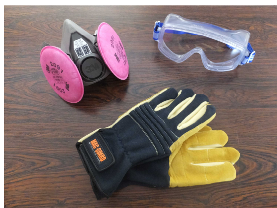
「消防団装備充実事業」