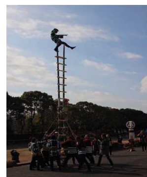
消防出初式 特別演技(はしご乗り) の様子