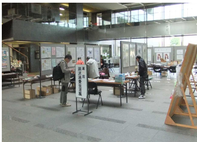
消費生活展の様子