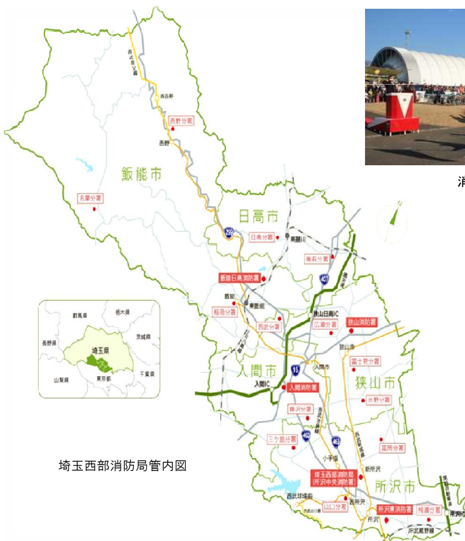
埼玉西部消防局管内図

■ 「第1次埼玉西部消防組合総合計画基本計画」に掲げる「主なとりくみ」を具現化するために実施する事務事業については、「第一次埼玉西部消防組合総合計画実施計画」に示されています。