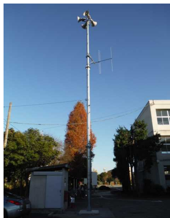
防災行政無線(中央小学校)