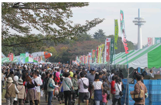
市民フェスティバル

【説明】 地域のつながりの変化に対する市民の受け止め方を測る指標です。 現状値は、平成25年度の市民意識調査の設問「あなたがお住まいの地域のつながりは、以前(5年程度前)と比べ、どのように変化したと感じますか」に対し、「強くなった」「どちらかといえば強くなった」と答えた人の割合です。 目標値は、20%をめざすものです。