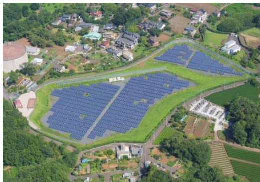
メガソーラー所沢 (愛称:とことこソーラー北野)

【説明】 ごみ減量に関する取り組みの成果を測る指標です。 現状値は、平成25年度における事業活動から出るごみや集団資源回収されるものなどを含まない、市民1人が1日に排出するごみの量です。 目標値は、平成30年度までに578 g/人・日をめざすものです。 ※578 g/人・日は「所沢市一般廃棄物処理基本計画」の平成32年度減量目標値566 g/人・日を按分したものです。