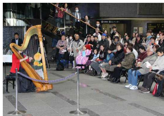
音楽のあるまちづくりコンサート