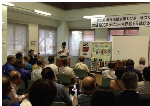
市民活動支援センターまつり 講演会「地域GOGOデビュー大作戦55歳からの地域デビュー」の様子