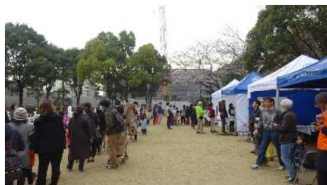
【東所沢公園サクラまつり】