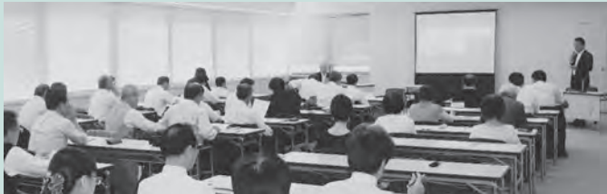
△マイナンバー制度に関する議員研修会