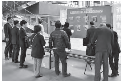
△表紙アンケートの様子 (市民ホール)