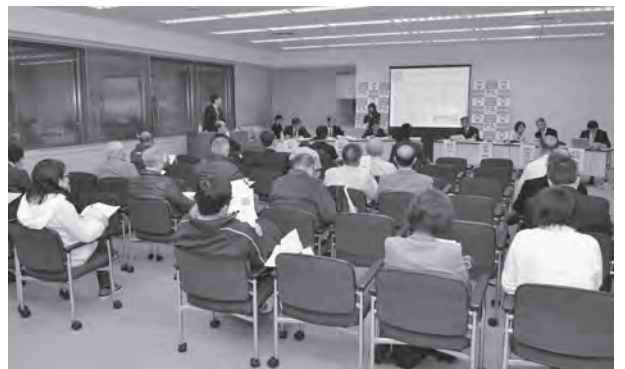
平成27年11月13日(金) 場所：所沢市役所全員協議会室