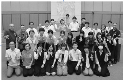
所沢西高校生徒22名

所沢市はみどりが多く、活かし方についてSNSを活用したPRなど、若い人は斬新であり、私としても良い学びの機会になりました。