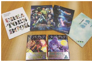
「機動戦士ガンダムクルス・ドアン」の鳥、「ダークギャザリング」など出演作品、朗読劇「風の聲～妖怪大戦争外伝～」で実際に使用した台本、一生懸命に役作りをして本番に臨んだので、どの作品も思い出が詰まっていると話していました。

碧葉さん 今は「新しいことに挑戦して視野を広げること」が目標です。これからも色々なことを経験して、今後の役作りに活かしていきたいです。