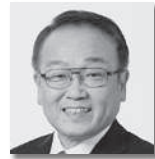
にしざわいちろう 西沢一郎④ [公明党]