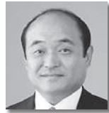
あお き としゆき 青木利幸③ [自由民主党]