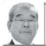
まつもとあきのぶ 松本明信 ③ [自由民主党]