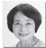
ひらい あけみ 平井明美⑨ [日本共産党]