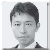
さの みつひこ 佐野允彦 ① [自由民主党・無所属の会]