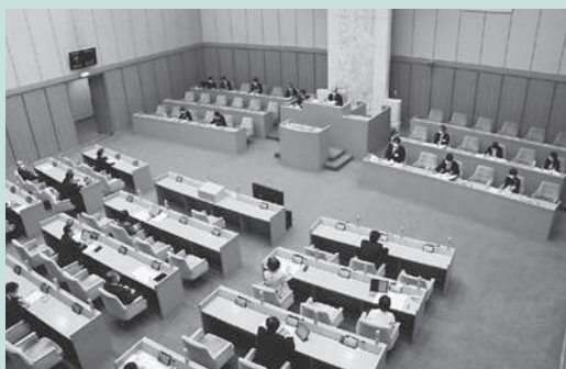
《令和2年第1回臨時会》

新規にテイクアウトや宅配を始める飲食店を対象に、広告宣伝費やパッケージ調達費等の事業転換に係る経費を補助するとともに、飲食店等の情報を集約したチラシを作成して全戸配布するなど、情報発信を行います。