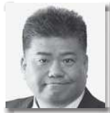
おおいしけんいち 大石健一 ④ [自由民主党・無所属の会]