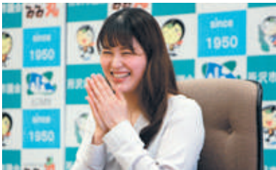
1994年、所沢市生まれ。松井小学校、東中学校、所沢北高校を卒業後、実践女子大学在学中にチアダンスチーム「CHEEKYS」に所属し、同チームが全米大会で初優勝した時はキャプテンを務めた。現在はチアダンスエンターテインメント集団にて活躍中である。