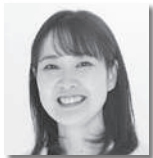
ながおかけいこ 長岡恵子① [立憲民主党]