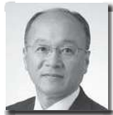
なか たけし 中 毅志 ⑤ [自由民主党]