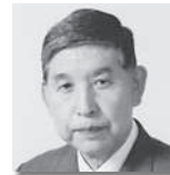
おさか せいえい 越阪部征衛⑥ [自由民主党]