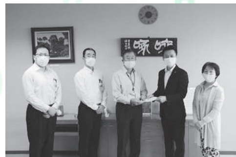
教育委員会に提言書を渡しました

新型コロナウイルス感染拡大防止対策に伴う小・中学校の臨時休業の影響で、様々な不安や悩みを抱える児童・生徒へのさらなる支援を検討することなどを提言しました。