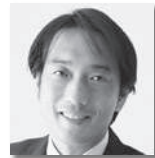
いりさわ ゆたか 入沢 豊③ [自由民主党・無所属の会]