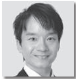
いしはら たかし 石原 昂② [自由民主党・無所属の会]