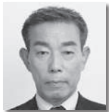
かすや ふじお 粕谷不二夫② [自由民主党]