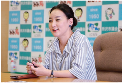
モンゴルのシルーステーム市生まれ。8歳から洋琴を習い始め、モンゴル国立芸術大学を卒業後、2000年来日。城西国際大学日本語学科で日本語を学びながら、音楽活動を開始し、「イフタタラガ」のメンバーとして、年に数回コンサートを開催している。結婚を機に、所沢に在住。

— 今後の目標を教えてください。 日本の曲をモンゴル調にアレンジして、アサル国際馬頭琴オーケストラで演奏してみたいです。また、洋琴の音色は和楽器にとっても合うと思うので、日本の音楽とモンゴルの曲調を融合させた曲を作ってみたいです。所沢を始め、日本の多くの人にモンゴルの民族音楽が広まっていくことを願っています。 アサル国際馬頭琴オーケストラで演奏したり、都内でリサイタルコンサートを開催したりしています。小学2年生が国語の授業で「スーホの白い馬（モンゴル民族楽器「馬頭琴」の由来にまつわる民話）を学習する時期には、馬頭琴奏者とともに小学校に招かれることが多いです。昨年の2月には、南小学校で演奏しました。