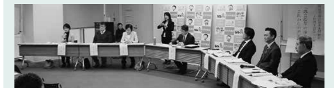
「市民満足度の高い議会へ」をテーマにパネルディスカッション