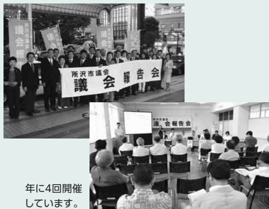
年に4回開催しています。

議会活動の状況を市民の皆さんに、議員が直接報告・説明するとともに、議会活動や市政について会場で自由に意見交換をする場です。