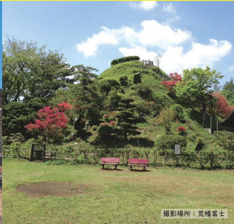
撮影場所：荒幡富士