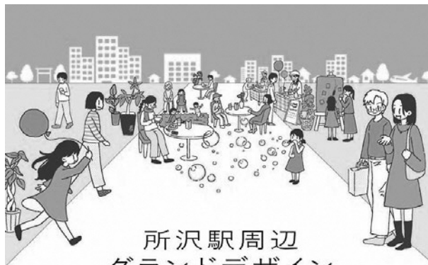
所沢駅周辺 グランドデザイン tokorozawa grand design